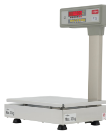
BMX0 Check-Out Tower